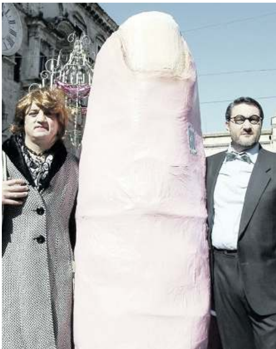
La maschera "Tra moggie e marite ne mette lu dite" in nomination